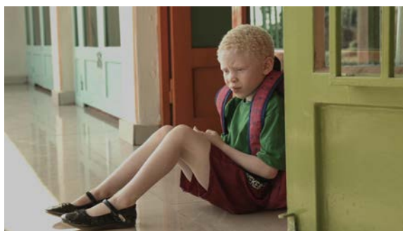
A PLACE FOR MYSELF Marie-Clémentine Dusabejambo – Fiction - Rwanda – 20 min – 2016

80 suit un homme durant les deux jours les plus importants de sa vie : celui où il est emprisonné et celui où il s'échappe.