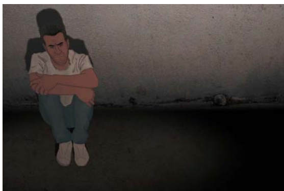
80 Muhannad Lamin – Libye – 6min – 2012

Qu'est ce que la Justice ? Celle, d'Etat, qui condamne parfois impartialement ses citoyens ? Celle, génétique, qui met de côté des personnes parce que considérées comme différentes ? Celle, sociale, qui exclue les plus pauvres ? Celle, professionnelle, qui isole les salariés de leur patron ? Ou celle, idéologique, qui conduit des groupes à vivre séparés d'autres communautés ? A travers 80 de Muhannad Lamin (Libye), A place for myself de Marie-Clémentine Dusabejambo (Rwanda), Madama Esther de Luck Razanajaona (Madagascar), The Aftermath of the Inauguration of the Public Toilet at Kilometer 375 de Omar El Zohairy (Egypte) et Kanye Kanye de Miklas Manneke (Afrique du Sud), la quatrième saison de Quartiers Lointains interroge la justice du Nord au Sud du continent africain.